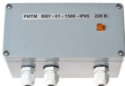
Рис. 1. ПДСВ в сборе