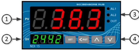
Рисунок А. Внешний вид дисплея и назначение кнопок управления

На лицевой панели прибора расположены два цифровых индикатора, светодиоды индикации состояния выходов и четыре кнопки управления: