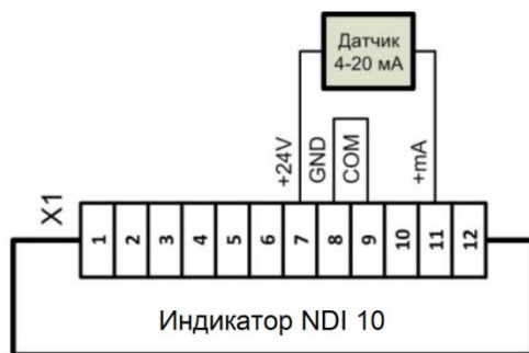
Рисунок 3. Пример подключения 2-х пров. датчика с токовым сигналом 4...20 мА от встроенного в индикатор источника питания (устанавливается перемычка между клеммами 8 и 9).

ЗАПРЕЩАЕТСЯ подавать напряжение питания, превышающее максимально допустимое значение для данной модели прибора!