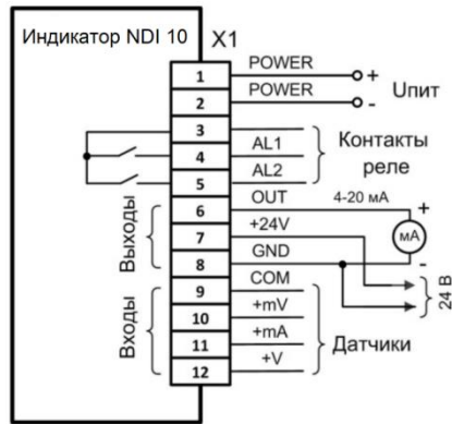
Рисунок 1. Общая схема подключения и контакты разъема.