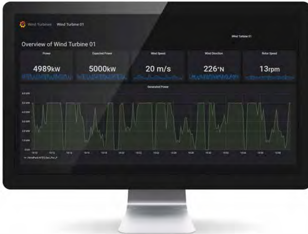
Рисунок 2. Данные могут отображаться и легко управляться через открытую платформу Grafana ( www.grafana.com ).

Подключение zenon Analyzer к Service Grid позволяет сделать результаты отчетов и прогнозы данных доступными для узла Service Hub. Сторонние приложения позволяют использовать широкий спектр сценариев дальнейшей обработки и обогащения данных. Информация может быть передана и доступна другим участникам через Service Hub, состоящий из двух скоординированных частей: Data Hub и Hub Controller. Data Hub обеспечивает передачу новостей и событий соответствующим получателям, а Hub Controller отвечает за поддержание прав доступа к отдельным службам. Hub Controller определяет допустимую степень доступа к службам и перенаправляет эту информацию в Data Hub. Индивидуальные данные доступа должны быть созданы для каждой службы. Они гарантируют, что только авторизованные службы могут потреблять и предоставлять данные.