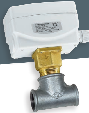
SW-3E / SW-4E с заслонкой вкл. Т-тройник