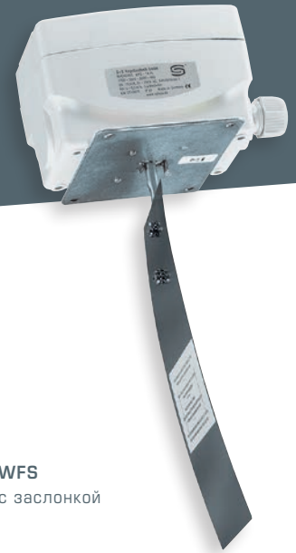
WFS с заслонкой