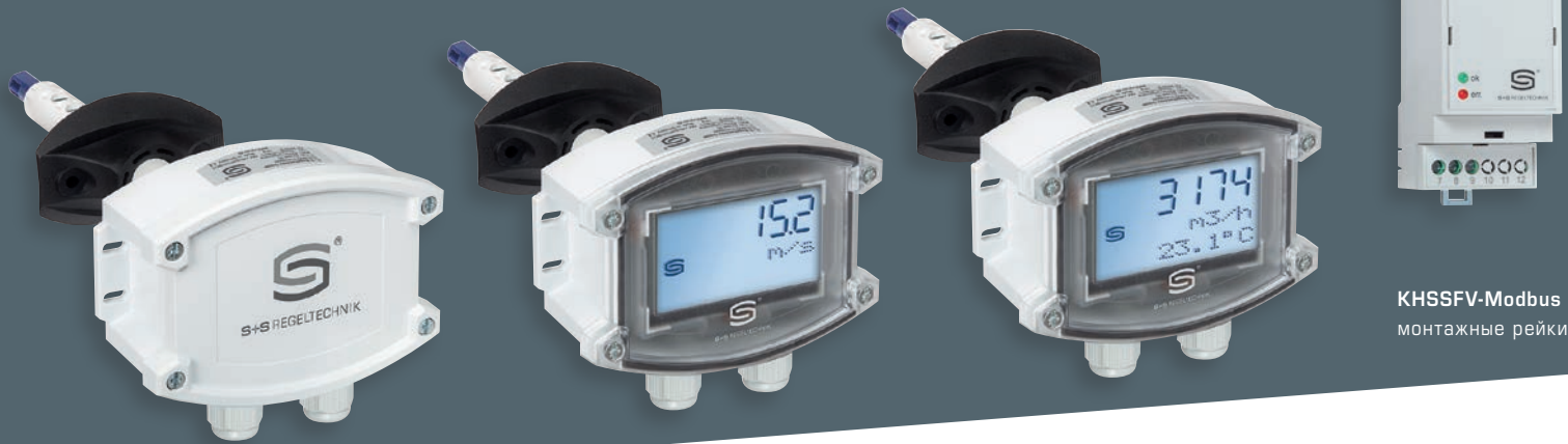
KLGf-Modbus без дисплея