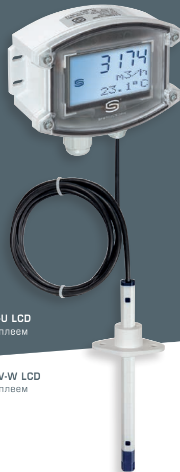
PLGF-U LCD с дисплеем