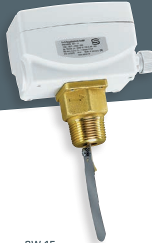
SW-1E с заслонкой